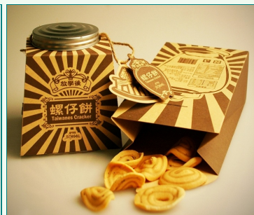
圖說：視傳系學生以「放學後柑仔店復古零食包裝」設計作品。