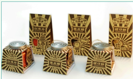
圖說：視傳系學生以「放學後柑仔店復古零食包裝」設計作品。

2012台灣視覺設計獎頒獎典禮12月5日舉行，所有獲獎作品明年3月起在高雄駁二藝術特區及全省巡迴展。